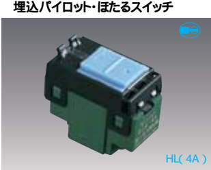
WT5041 標準価格1,250円 税抜 埋込パイロット・ほたるスイッチB(片切) AC4A 100V用

埋込パイロット・ほたるスイッチは、ハンドルの組合せにより、ネームなしスイッチ・ネーム付スイッチのいずれにもお使いいただけます。