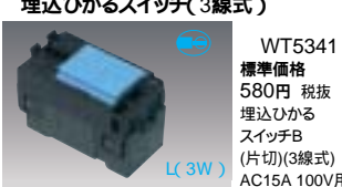
WT5341 標準価格580円 税抜 埋込ひかるスイッチB(片切) AC15A 100V用