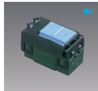
WT5001 標準価格190円 税抜 埋込スイッチB(片切) AC15A 300V用

埋込スイッチ(表示なしスイッチ)は、ハンドルの組合せにより、ネームなしスイッチ・ネーム付スイッチのいずれにもお使いいただけます。