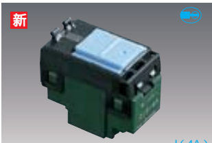
WT5241 標準価格1,050円 税抜 埋込パイロットスイッチB(片切) AC4A 100V用